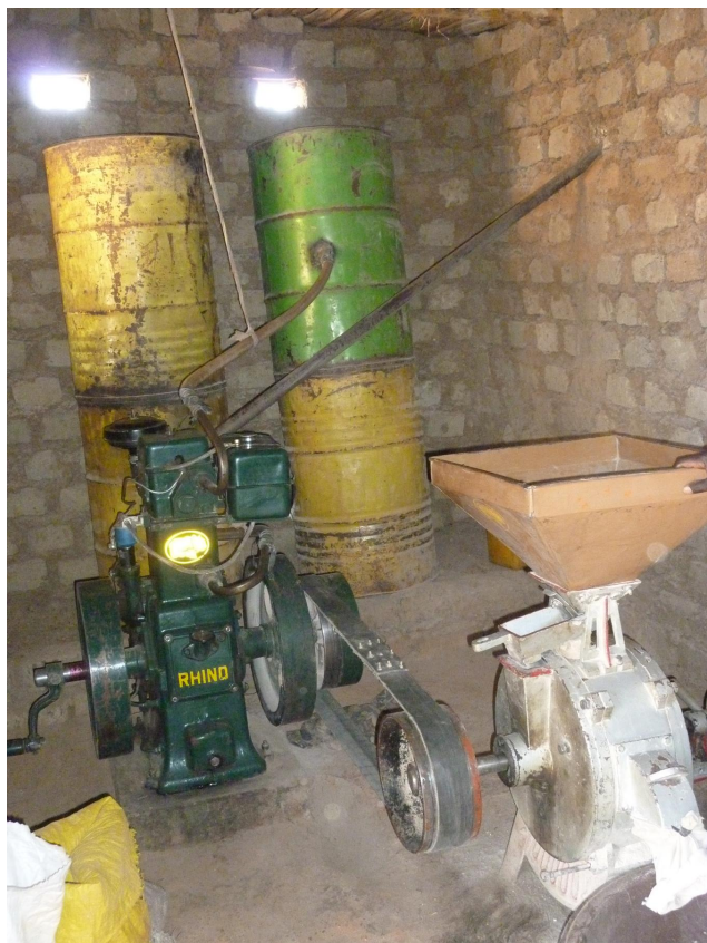
le moulin dessiné par un jeune burkinabè le moulin de Viré Sogodin (les bidons sont remplis d'eau et servent au refroidissement du moteur)